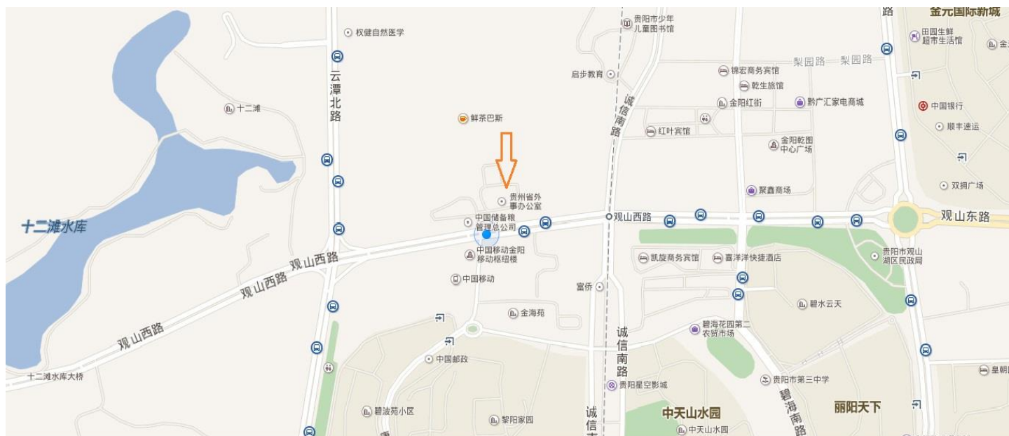
贵州省外事办公室地址：贵州省贵阳市观山湖区观山西路172号。图中黄色箭头标记处。